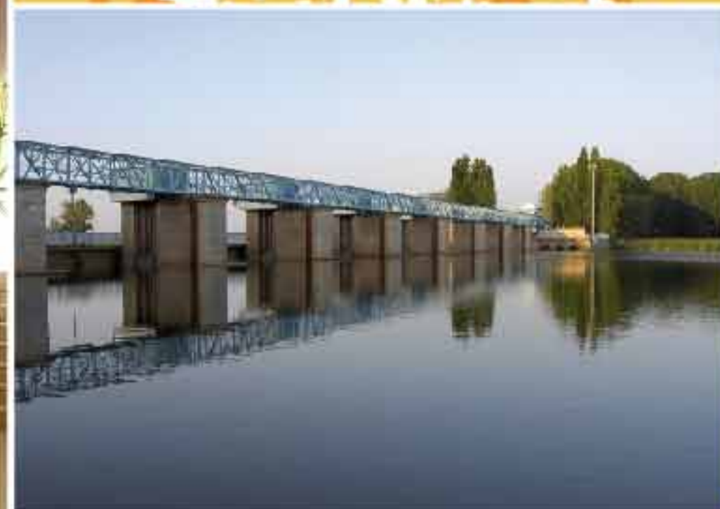
Embalse de San José