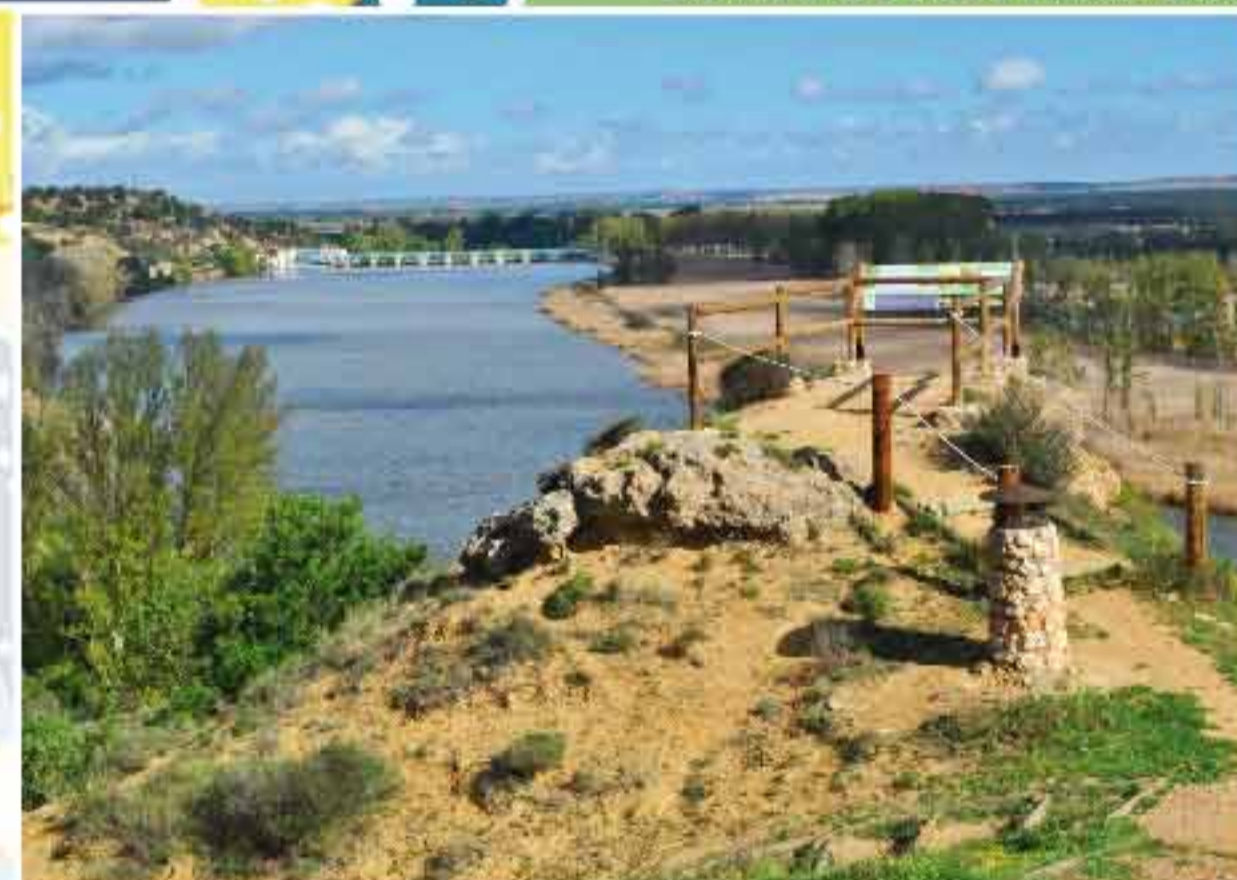
Senda de los Almendros

Junto al embalse, esta playa fue en décadas pasadas el principal atractivo veraniego para las comarcas de Tierras de Medina y La Guareña. Apta para el baño, sigue siendo actualmente un importante motivo para visitar Castronuño en época estival.