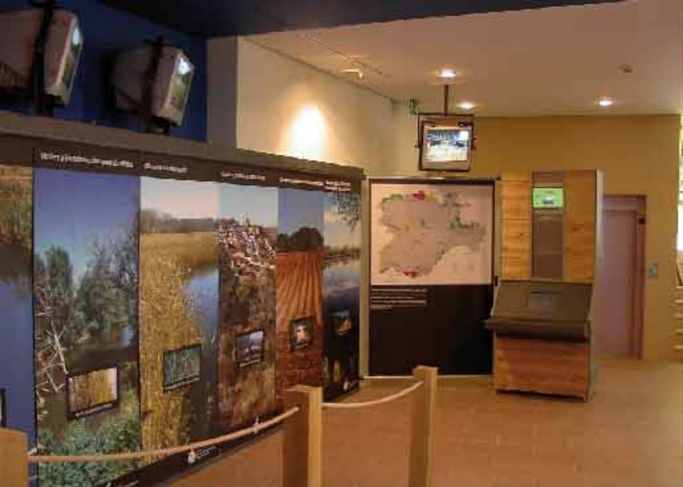
Casa de la Reserva