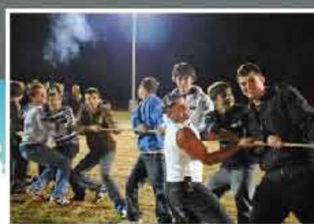
1 de Mayo